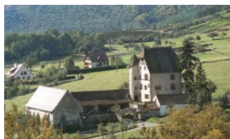
Walbach 03 89 71 13 11