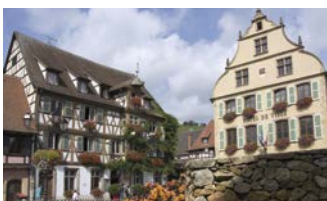
Turckheim 03 89 27 18 08