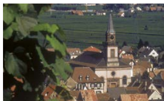
Wintzenheim 03 89 27 94 94