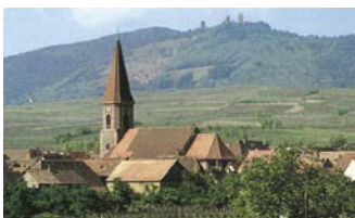
Wettolsheim 03 89 22 90 30