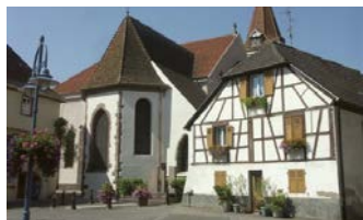
Herrlisheim 03 89 49 39 80