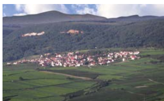
Voegtlinshoffen 03 89 49 30 31